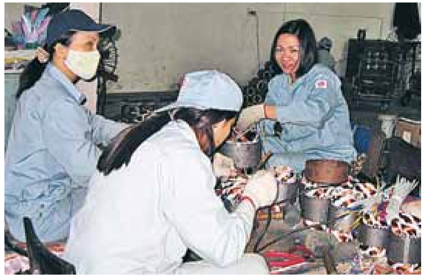
MOGNAR SOM FACKLIGA FÖRETRÄDARE. Vietnam har jämfört med många andra fattiga länder en hög organisationsgrad.